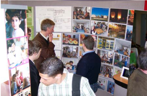
einer der Messestände