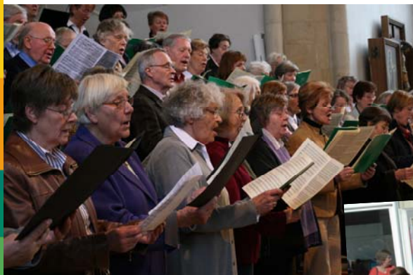
Auftritt des AChOM

So blicken wir auf einen gelungenen zweiten MGH-Geburtstag zurück.