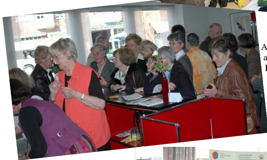
Andrang auf den Kuchentresen